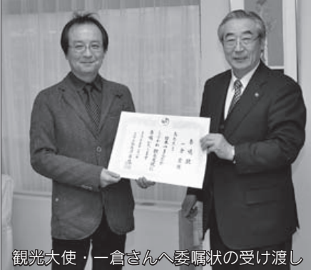
観光大使・一倉さんへ委嘱状の受け渡し

県や市町村、観光協会などでは、主に観光地や地域振興を目的として、観光大使の委嘱を行っています(団体によってはふるさと大使・広報大使などの名称があります)。