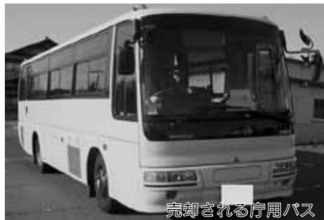
売却される庁用バス