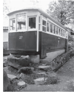
テーマはチンチン電車

時 3月12日(火)午前9時～正午 集合場所 中央公民館玄関 内 伊香保へのチンチン電車の軌道跡(渋川駅-伊香保)を車に分乗して巡ります。 師 狩野信利さん(中村) 対 おおむね60歳以上の人 定 17人(超えた場合は抽選) 費 無料 申 電話か直接窓口へ