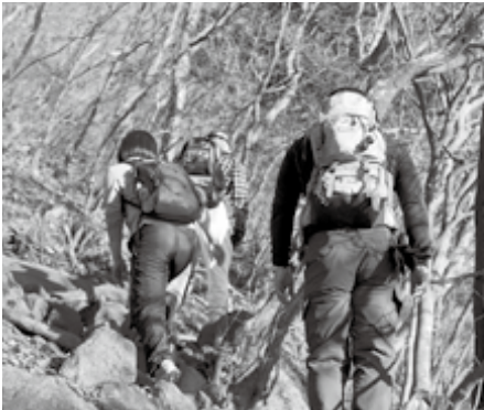
山登りの魅力を紹介します