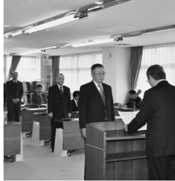
表彰を受ける受賞者

市が発注し、前年度に完成した工事の中から、施工管理や技術などが特に優れている業者などを表彰する、平成23年度優良建設工事等表彰式が、11月18日