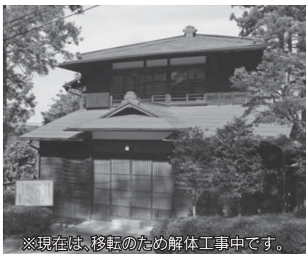
※現在は、移転のため解体工事中です。