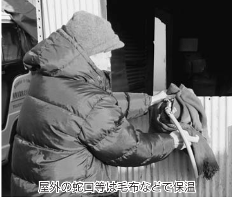
屋外の蛇口等は毛布などで保温

これから寒さが一段と厳しくなり、凍結による水道管の事故が多くなります。もしも、水道管の破裂や凍結の事故が発生したときは、市の水道事業指定給水装置工事業者に修理を依頼してください。指定給水装置工事事業者については、 水道課 （☎22119）へ問い合わせるか、市ホームページ（ http://www.city.shibukawa.gunma.jp ）をご覧ください。