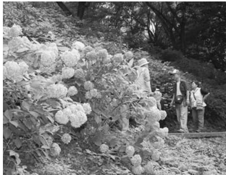
満開のアジサイの中を歩きませんか？

市では、アジサイの開花時期に合わせて、6月18日(土)から7月10日(日)まで、あじさいまつりを開催します。小野池あじさい公園へ、ぜひ、お出掛けください。