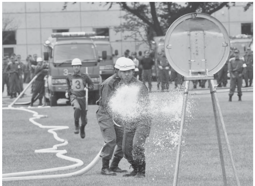
ホースをつなぎ標的を目掛けていち早く放水

6月5日、子持ふれあい公園で市消防団の全30分団が参加し、「市消防団ポンプ操法競技会」が開催されました。この日のために、連日にわたる練習に取り組んできた選手たちは、その成果を存分に発揮して迫力あるポンプ操法を披露。見事、優勝を果たした27分団をはじめ、上位6位までの分団は、県消防協会渋川支部大会に出場します。