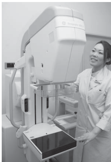
マンモグラフィーでの乳がん検診

を促進するため、特定年齢の女性に、子宮けいがん・乳がん検診の費用が無料になるクーポン券を発行します。対象者には、受診案内、無料クーポン券および検診手帳を送付します。