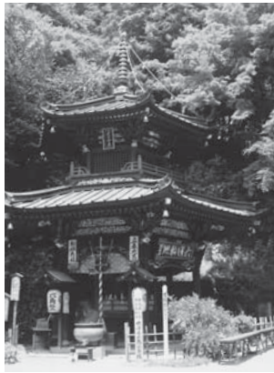
水澤寺六角二重塔 (伊香保地区)