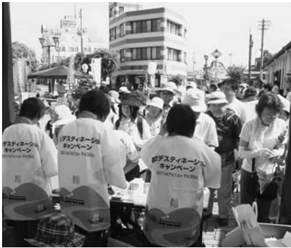
受け付け後は自分のペースで自由散策