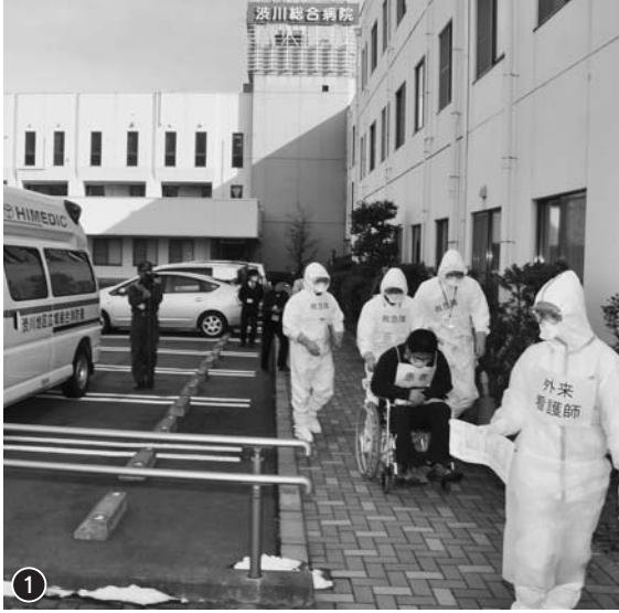
写真①～③=県の感染症指定医療機関に指定されている渋川総合病院では1月27日、県や医師会、渋川広域消防などと合同で「新型インフルエンザ対応総合訓練」を実施。感染者発生時における迅速・的確な対応を確認しました。