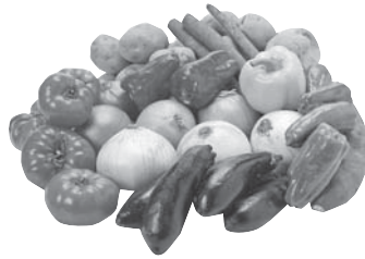
家庭菜園を始めてみませんか

市では、家庭菜園や花づく りなどをしたい人のために、 遊休農地を活用した市民農園 を開設しています。平成24年 4月から新たに利用を希望す る人は、申し込みください。 貸付期間 4月1日～平成25 年3月末 申込資格 市内在住の農業者 以外の人 申込方法 申込書(次の地区 別申込先にあります)を利用 を希望する地区の申込先へ 申込開始日 2月23日(木) ※いずれも先着順で受付。 〈 洪川地区 〉 対象区画 Ⅴ行幸田市民農園 Ⅱ5区画 Ⅴ上郷市民農園