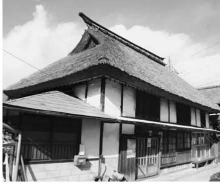
空ヶ橋関所跡(附関係資料) (渋川地区)