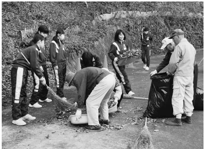
3年生は登沢の通学路を清掃

金島中学校の「クリーン作戦2010」が11月25日に開催されました。生徒は、通学に使う道路や見守ってくれる地域の人に感謝の気持ちを込めて、学年ごとに3カ所に分かれ、地元老人会などの約110人と清掃活動を実施。竹ぼうきを手手に大量の落ち葉やごみを集め終わると「気持ちがすっきりした」と充実した様子でした。