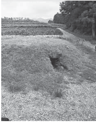
中ノ峯古墳 (子持地区)