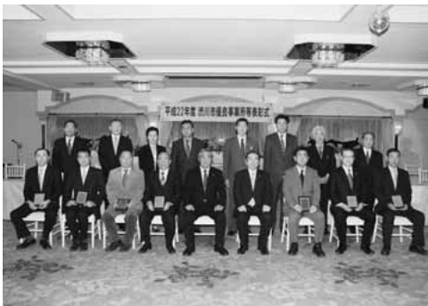
表彰式に出席した皆さん