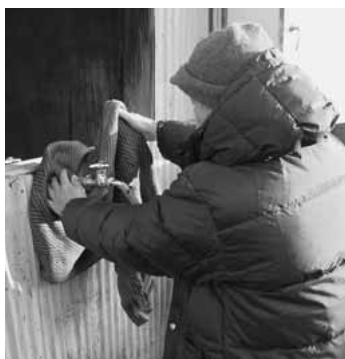
屋外の蛇口は毛布で保温

これから寒さが一段と厳しくなり、凍結による水道管の事故が多くなります。水道管の凍結や破裂の事故が発生したときは、市の水道事業指定給水装置工事業業者に修理を依頼してください。指定給水装置工事業業者については、水道課(☎22119)へ問い合わせるか、市ホームページ( http://www.city.shibukawa.gunma.jp/ )をご覧ください。