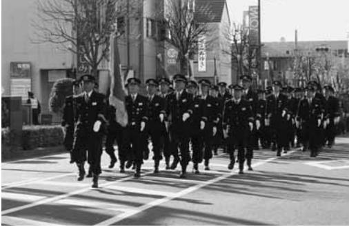
前回の出初式の市消防隊パレードの様子

交通規制 当日午前9時30分から正午まで、熊野東交差点～新町五差路交差点の区間が通行止めになります