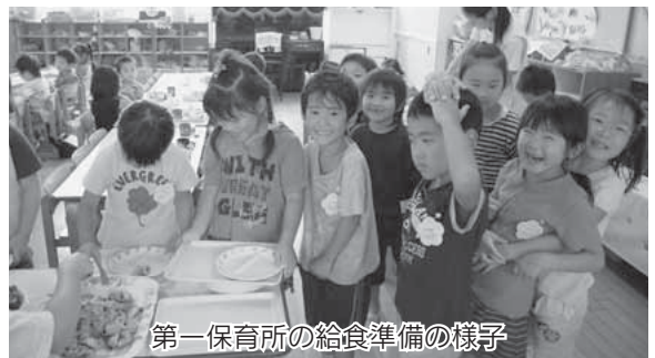
第一保育所の給食準備の様子