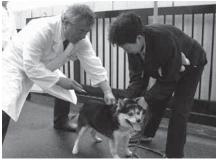
別表1 登録と注射ができる動物病院