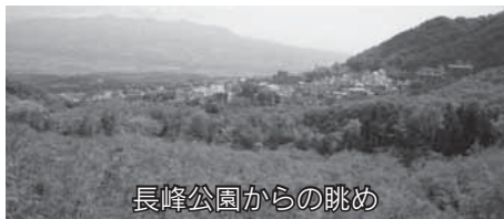
長峰公園からの眺め

市観光協会では、渋川の初夏を満喫するモニターバスツアーを実施します。今回は、伊香保のつつじを眺め、陶芸を体験した後で、美人の湯につかり、最後に漬物工場を見学していただくコースです。