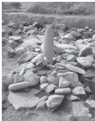
瀧沢石器時代遺跡 (赤城地区)