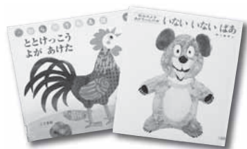
読み聞かせに使われる絵本

に読み聞かせを実践できるよう、読み聞かせに使用した絵本や資料などを差し上げます。 配布するもの 絵本「いないいないばあ」「ととけっこうよが あけた」、読み聞かせについての冊子、おすすめ本の一覧 詳しくは、市立図書館(☎②0644)へ。