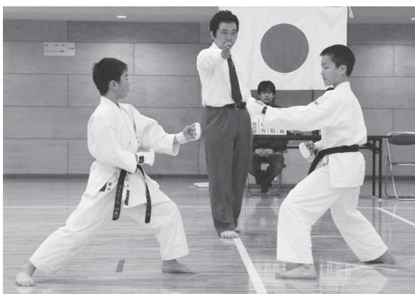
空手道の組手 くみて を披露「いざ、勝負!」

市武道館で3月28日に開催された「第14回渋川市武道フェスティバル」。式典では、功労者や優秀選手表彰などを実施。演武会では、市武道振興会に加盟する空手道、剣道、少林寺拳法、弓道の4団体が日ごろの練習の成果を披露しました。午後からは体験教室なども実施され、強い心と体を育てる「武道」の普及活動を行いました。