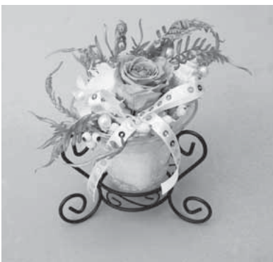
▶色合いも涼やかな夏のアレンジ