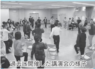
過去に開催した講演会の様子