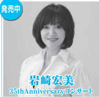
岩崎宏美 35th Anniversaryコンサート