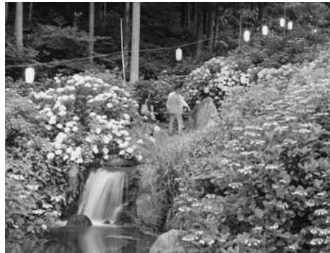
幻想的なあじさい公園をお楽しみください