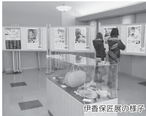
伊香保匠展の様子