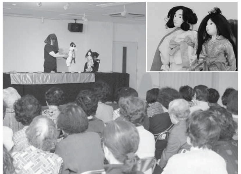
ヤマトタケルとオトタチバナヒメの物語を上演

渋川公民館で、5月19日に神流町考古劇場会による「人形劇ヤマトタケルー神流川の伝説」が上演されました。今回の劇は、神流町に伝わるヤマトタケルの伝説を3幕に分けて披露。参加者は、精巧な人形や舞台美術などを手作りした劇を楽しみました。同会の劇は、8月に行われる「たちばな古里まつり」で上演される予定です。