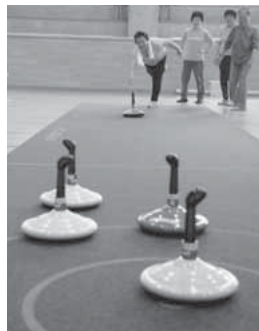
カーリングのような競技です