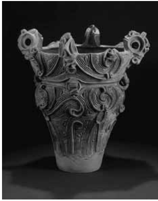
道訓前遺跡出土品 (北橋地区)