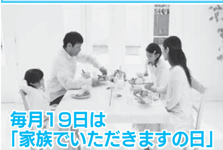
毎月19日は「家族でいただきますの日」