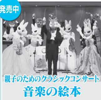
親子のためのクラシックコンサート 音楽の絵本