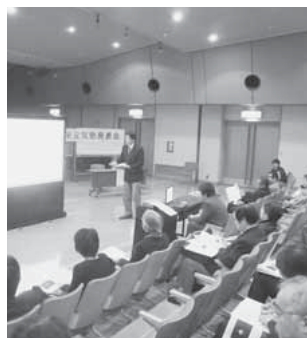
伊香保元気塾の発表会

12月から2月まで開催しました。このイベントでは、伊香保の新たな魅力を発見してもらうため、伊香保をはじめ、本市が主な舞台のオリジナル小説(ストーリーブック)を読みながら、伊香保を散策してもらいました。冬季の開催にもかかわらず、1,500冊用意したストーリーブックが在庫切れになるほど、多くの人が参加しました。 また、「伊香保匠展」を2月1日から3月22日に、伊香保温泉まちの駅5階展望ホールで開催しました。