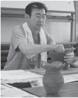
土器づくりに集中!

文化財保護課 ☎2102 とき・内容 ①7月4日(日)午 後1時30分～4時30分 ②粘土 調合 ③7月17日(土)、18日(日) 午前10時～午後4時 ④土器制 作 ⑤9月25日(土)午前9時～ 午後2時ごろ ⑥土器焼成 ところ 北橋歴史資料館(北 橋町真壁) 講師 土の会(土器づくりの 会)の皆さん 対象者 市内在住・在勤の成 人で、全日程参加できる人 定員 10人(超えた場合は抽 選) 参加料 1,000円(粘土代) 申込方法 電話か直接北橋歴 史資料館(☎4094)へ ※月曜日を除く午前9時～午 後5時。 申込期限 6月27日(日)