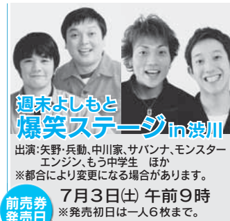
週末よしもと 爆笑ステージin渋川

出演:矢野・兵動、中川家、サバンナ、モンスターエンジン、もう中学生、ほか ※都合により変更になる場合があります。