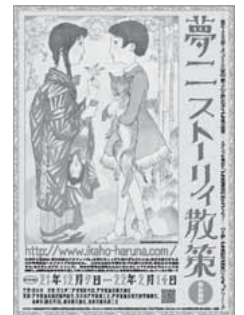
昨年度のPR用チラシ

そのうちのひとつとして、平成21年度で3回目となる「夢二ストーリーイ散策」を、昨年