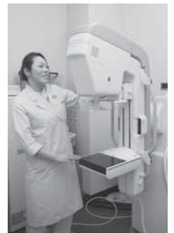
乳ガン検診に使用するマンモグラフィー

▽子宮けいがん検診対象年齢Ⅱ 20歳(平成元年4月2日)～2年4月1日(生まれ)、25歳(昭和59年4月2日)～60年4月1日(生まれ)、30歳(昭和54年4月2日)～55年4月1日(生まれ)、35歳(昭和49年4月2日)～50年4月1日(生まれ)、40歳(昭和44年4月2日)～45年4月1日(生まれ) ▽乳がん検診対象年齢Ⅱ 40歳(昭和44年4月2日)～45年4月1日(生まれ)、45歳(昭和39年4月2日)～昭和40年4月1日(生まれ)