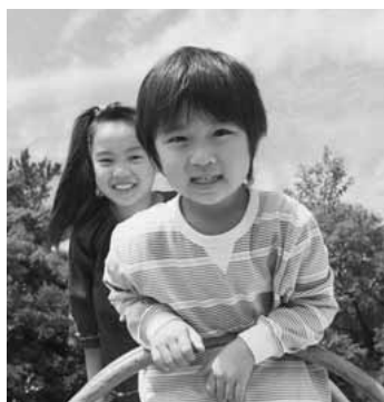
次代の社会を担う子どもたちのために