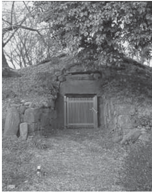
虚空蔵塚古墳 (渋川地区)