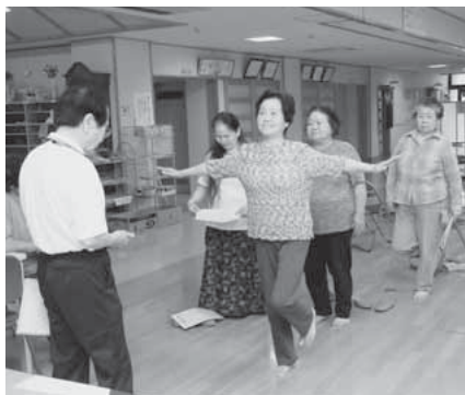
開眼片足立ちに挑戦する参加者