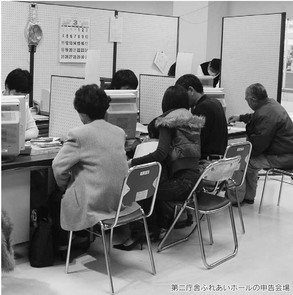
第二庁舎ふれあいホールの申告会場

今年の1月1日現在で、本市に住んでいる人を対象に、2月1日(火)から市県民税・所得税申告の受け付けを始めます。第二庁舎と各総合支所とで受付期間が異なりますので注意してください(別表参照)。