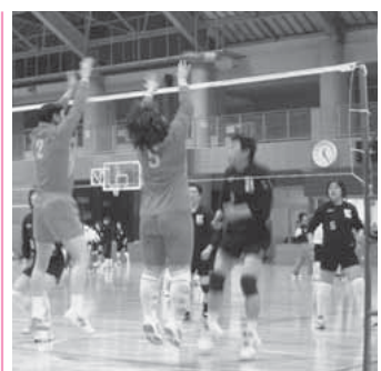
気の合う仲間とぜひ参加を!