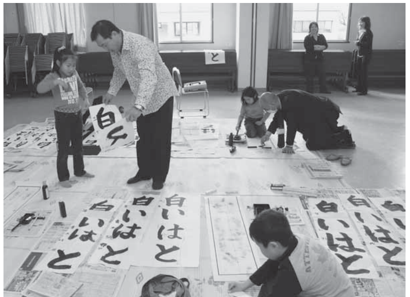
床一面に広がる書き初め課題「白いはと」

赤城公民館で1月6日に行われた「書き初め教室」。参加した地元の小学生たちは、学年ごとの課題を仕上げるため、約2時間、集中して書き初め用紙に向かいました。初めは筆の使い方や文字の間隔の取り方に苦戦していたものの、講師に手を貸してもらいながら何枚も練習。最後には、それぞれが納得の1枚を書き上げました。