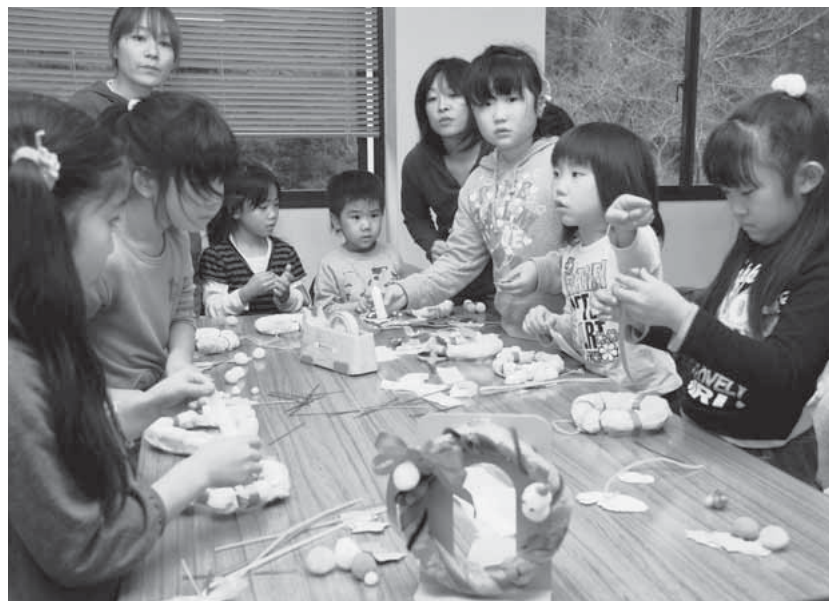
飾り付けは自分流！かわいらしくリースを仕上げます

この日の放課後、参加した地元の児童35人は、新聞紙でリースとなる輪を作り、さまざまな色のリボンやフェルトなど、好みの材料で飾り付け、かわいらしいクリスマスリースを作りました。