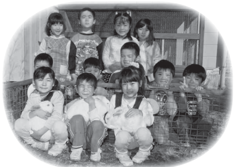
こもち幼稚園のウサギは、園児たちの人気者