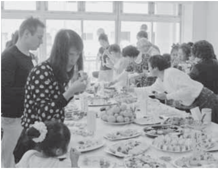
立食ランチで楽しい交流を