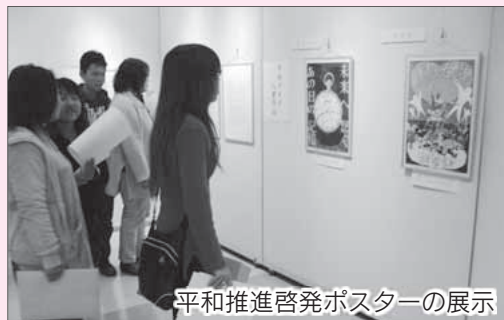
平和推進啓発ポスターの展示