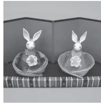
かわいい置物が完成します

申込方法 電話か窓口へ 申込期間 1月11日(火)～13日(木)午前8時30分～午後5時