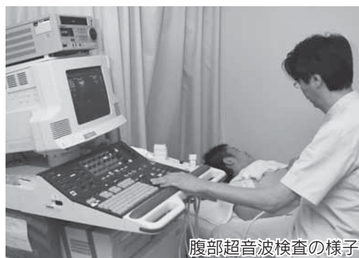
腹部超音波検査の様子

この調査は、平成23年度に市が行う結核検診・胸部レントゲン検診や各種健康診査、各種がん検診などの受診希望者を把握し、希望者に受診票を送付するために、20歳以上の人を対象に実施します。