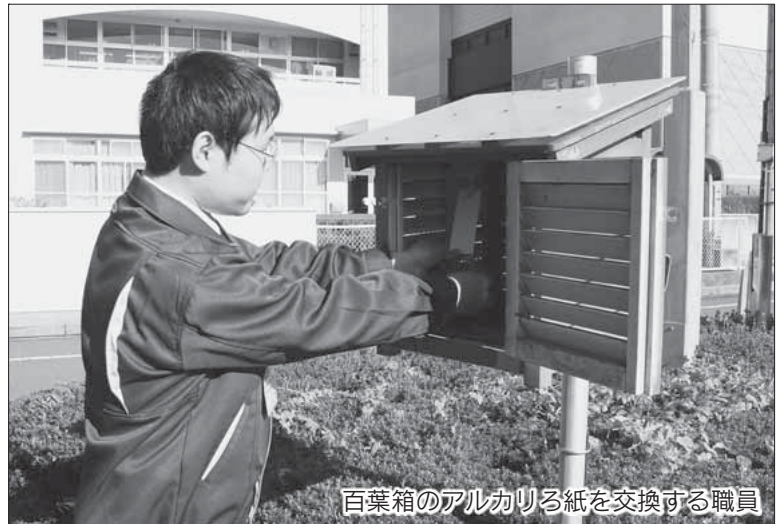
百葉箱のアルカリ紙を交換する職員

今回は、本市の大気汚染監視体制と、測定結果による大気環境の状況についてお知らせします。