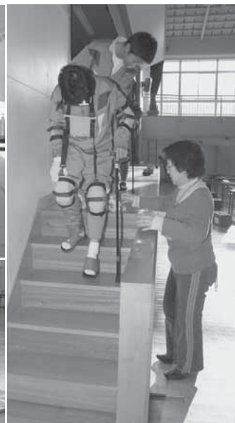
視覚障害者体験(左上) 車いす体験(左下) 高齢者疑似体験(右)