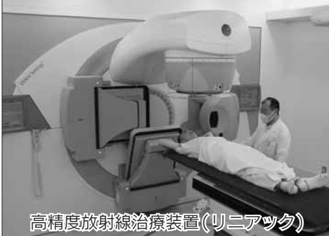
高精度放射線治療装置(リニアック)