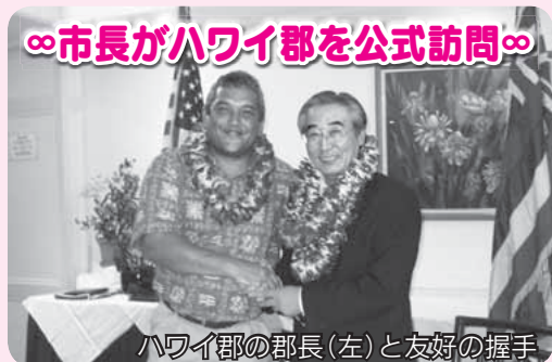
ハワイ郡の郡長(左)と友好の握手

1月14日から18日まで、本市の姉妹都市であるアメリカ・ハワイ郡へ、市長が公式訪問しました。今回の訪問では、旧伊香保町の時に結ばれた協定の再確認が行われ、これからの親交を確かめました。