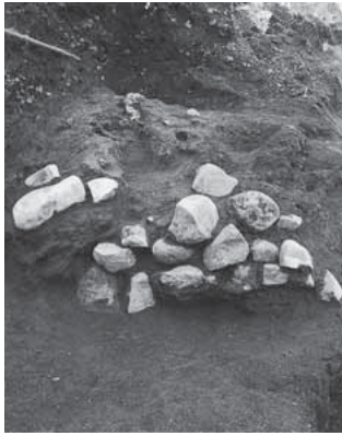
金井製鉄遺跡 (渋川地区)