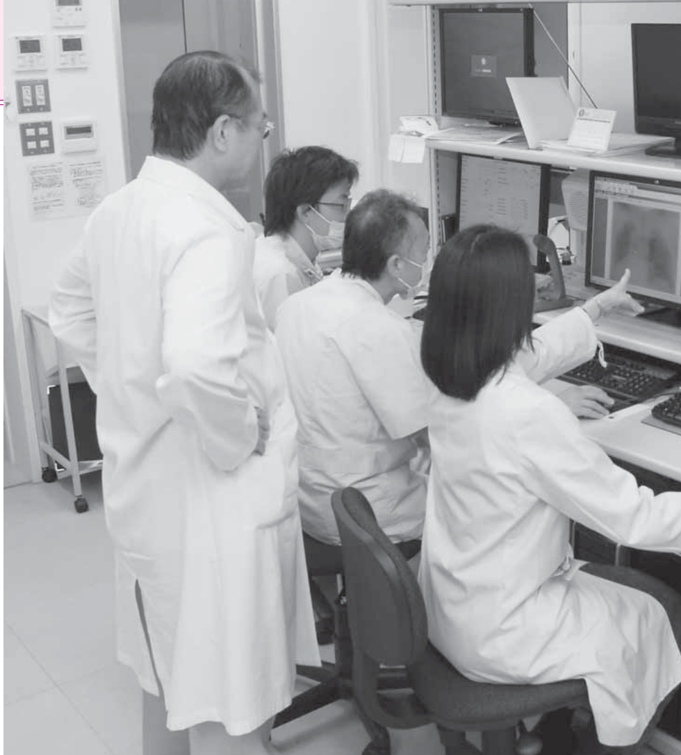
■ CT画像を見ながら治療計画を立てる放射線科のスタッフ

特に、当院で扱う前立腺がんの患者さんが増えており、IMRTを受けてもらうために前橋や高崎の病院を紹介していたことを考えると、市内でこの治療を受けられるのは素晴らしいことだと思います。