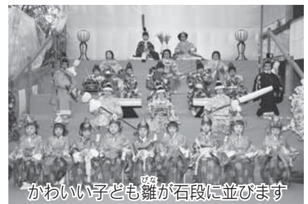
かわいい子ども雛が石段に並びます

石段街をひな壇に見立て、ほんのり薄化粧をした保育園児が子ども雛を演じる早春の伊香保温泉恒例の行事です。