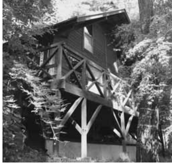
森の中にひっそりと建つコテージ

参加方法 当日直接会場へ 問い合わせ先 権利擁護セン ターぱあとなあ群馬渋川支部 (障害福祉なんでも相談室内) ☎302094