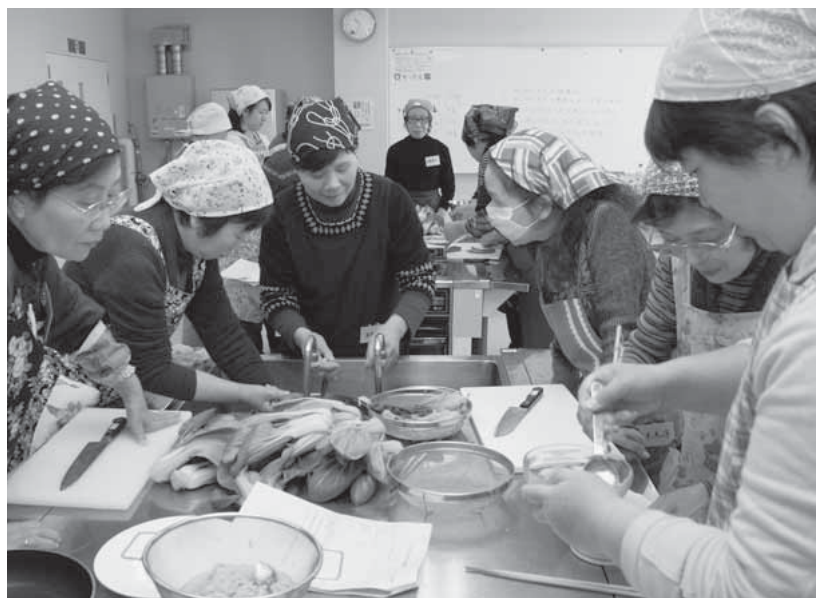
地元渋川で採れた新鮮なチンゲンサイを使って5品を調理

会場では、料理講習会のほか、生産者の事例発表や農業のPR方法についての講演会が行われました。チンゲンサイ生産農家の女性が指導に当たった料理講習では、新鮮なチンゲンサイを使った家庭料理5品を作り、身近な地産野菜のおいしさを再発見しました。