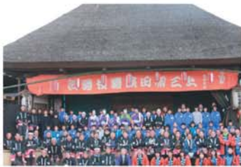
歌舞伎公演を終えて

その一つとして、伝承委員会と連携し地域行事活性化運動である歌舞伎をテーマにした取り組みを行いました。三原田小3年生と赤城南中1年生がそれぞれ、総合学習で歌舞伎について3回の授業を行いました。そして11月19日には、上三原田にある国指定重要有形民俗文化財である舞台で歌舞伎公演を行いました。三原田小からは役者としての係として、公演の運営に関わりました。また、5・6年生有志によるロックソールの披露もありました。