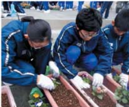
全生徒による冬の植栽作業

生徒は、地域の人に見守られていることに感謝するとともに、地域の行事にも積極的に参加し、住みよい町づくりを目指しています。地域と共に活動することを通して、安全で安心な町で、伸び伸びと成長することを願っています。