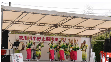
若草連による阿波踊り