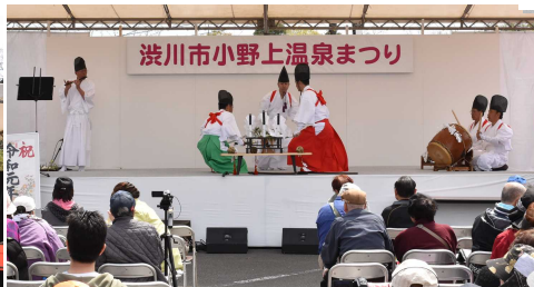
郷土芸能村上太々神楽