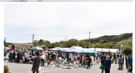
フリーマーケットも盛況でした