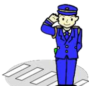
交通ルールを守りましょう!