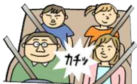
車に乗ったら、シートベルト