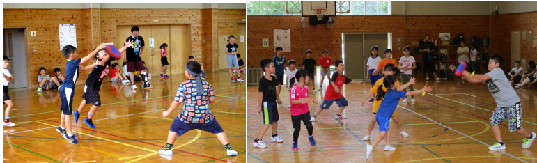
今年度の大会の様子