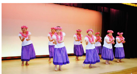
オ・オノコホロマカニ