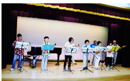
あじさいウクレレサークル