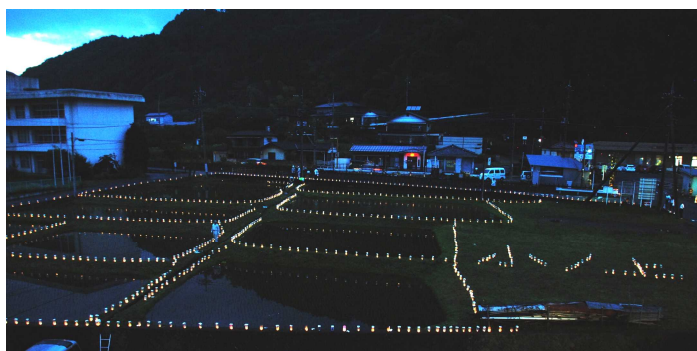
ランタンに照らされた美しい風景

令和元年6月22日(土)に生涯学習おのがみチーム主催による第4回ランタン祭りinおのがみが開催されました。