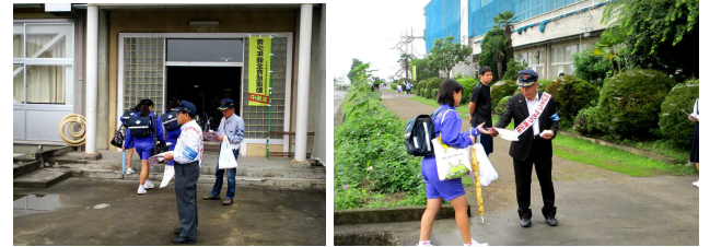
子持中学校で健全育成運動を行いました。

7月10日(水)、11日(木)に青少年育成推進員による「夏の青少年健全育成運動」が子持中学校と渋川高等学校で行われ、通学途中の生徒にチラシやティッシュを配布し、「おぜのかみさま」県民運動の周知を図りました。