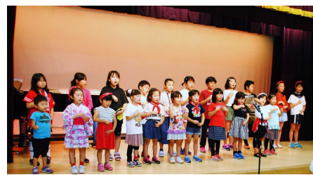
マンマ・おのがみ (子どもの手話歌)