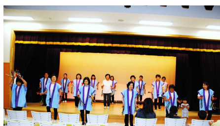
おのがみレディースクラブ