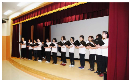
コーロ・おのがみ