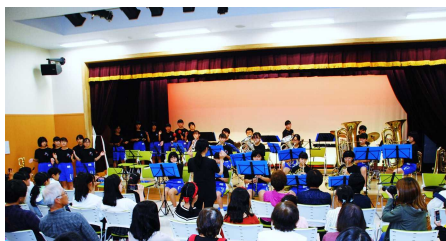
子持中学校吹奏楽部