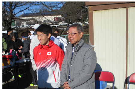
唐澤選手(左)と渋川市長(右)