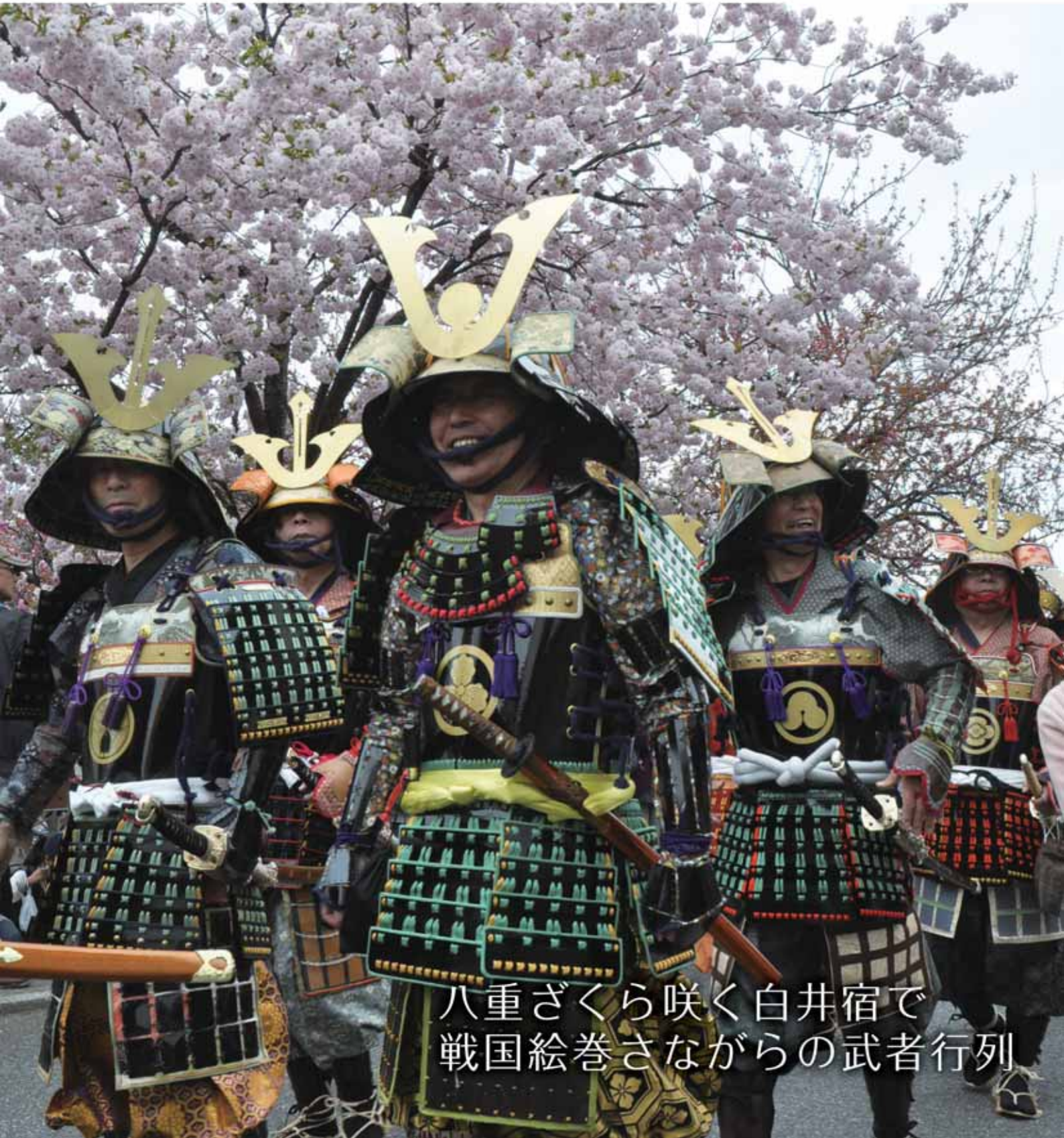
八重ざくら咲く白井宿で 戦国絵巻さながらの武者行列