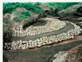
空沢古墳群(第3号墳)

〔空沢古墳群〕 空沢古墳群は、中筋遺跡の東側に広がる古墳群です。現在までに57基の古墳が発見され、榛名山の6世紀初めの火山灰と6世紀中頃の軽石とをはさんで営まれています。