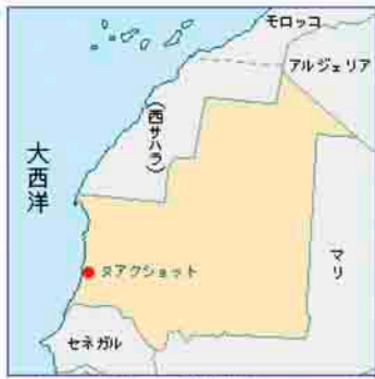
モーリタニア位置図