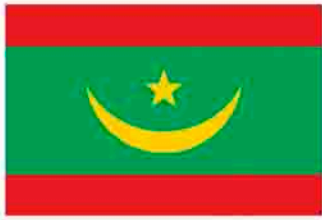
モーリタニア国旗

正式名称は『モーリタニア・イスラム共和国』。 日本から約1万3000キロ離れたアフリカ大陸の西部に位置し、国のほとんどが乾燥地帯です。 大西洋に面していて、世界有数のタコの産地です。 日本がタコの最大の輸出先になっています。 首都 ヌアクシヨット