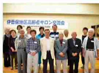
伊香保もみじの会のみなさん

伊香保もみじの会は、伊香保地区の困りごとについて情報を共有し、連携強化を図りながら解決方法を話し合っていく場として、平成30年3月に発足しました。