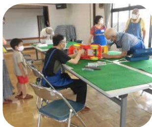
おもちゃの車を診察中

今回は8月22日、午後1時半から4時までです。「思いのおもちゃ」から「愛用のおもちゃ」まで喜んで診察いたします。ぜひお出かけください。