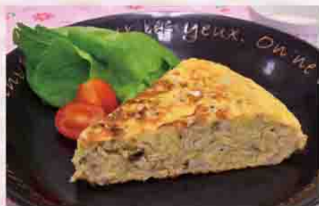
[1人分の栄養価]エネルギー277kcal、カルシウム269mg、食塩相当量1.0g