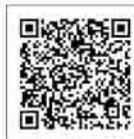
県のホームページ はこちら