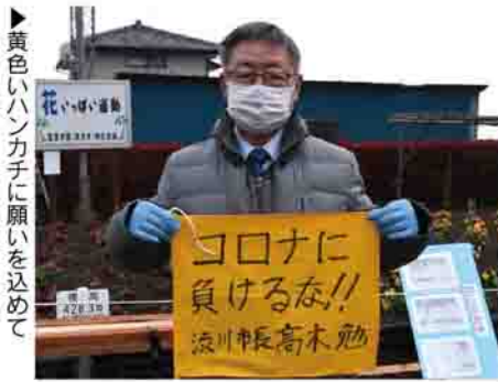
▶黄色いハンカチに願いを込めて

4月12日、赤城町溝呂木自治会の皆さんが、地域の子どもたちと一緒にコロナ収束の願いを込めて、溝呂木四つ角「花いっぱい花壇」に黄色いハンカチを掲げました。ハンカチには、「学校で遊びたい」「友達に会いたい」「普通の生活がしたい」などの切実な思いが書