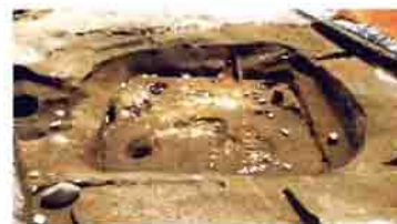
7世紀初めの住居跡(白井地内)

6世紀中頃の榛名山大噴火は軽石中心だったため、避難して逃げ延びた人も多かったようです。7世紀初めには白井地区で集落の復興がはじまり、馬具や鉄製武器を副葬した径20m弱の古墳も築かれていきます。馬飼育集団を統率しつつ、騎兵として軍事力を担う者たちが現れつつあったのです。