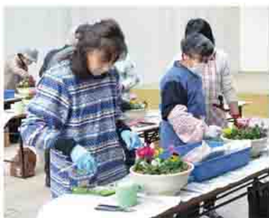
花の寄せ植えを体験します

応募方法 用紙(様式は問いません)に、住所、氏名、年齢、職業、電話番号、応募の動機や地域福祉についての考えを200字程度で記入し、郵送、ファクスまたはメールで地域包括ケア課(☎377-1850 1・石原80 ☎22327・☎