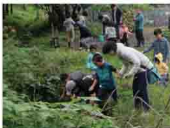
学習会では今やほとんど見ることで見えない水生昆虫を観察できます

宮田ほたるの里を守る会は、ホタルの保護活動を通じて、地域の交流の場や子どもたちへの自然環境教育、他地区との交流などを進めています。