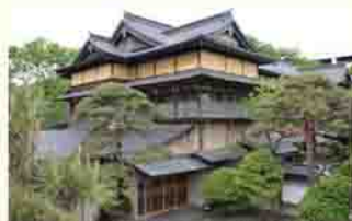
旧料亭金勇

秋田県能代市は、男鹿半島の北側にあり、日本海沿岸、米代川河口に位置しています。冬は強い海風が吹き、海沿いに広がるクロマツの砂防林は「風の松原」と呼ばれ、さまざまな風景100選に選ばれる絶景です。また、秋田杉の木材加工で栄えたまちとして、皆さんにお勧めしたい場所は、国登録有形文化財「旧料亭金勇」です。約5間ある秋田杉の一枚板の存在感は、一見の価値があります。私の出身校、能代工業高校のバスケットボールでの活躍も有名で、「バスケのまち」としても売り出しています。