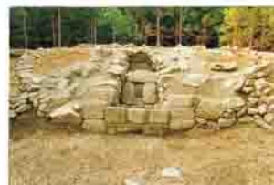
金井古墳の横穴式石室

古墳は見通しの良い場所に造ることが多いのですが、金井古墳は東側の平地からは見えません。7世紀には中国から風水の思想が入ってきます。北側の山を背にして、東西を丘に囲まれ、南側は水が流れて少し開けた場所に墓を造るのが良いとされます。金井古墳の築造には、当時のそんな新来の思想が影響しているようです。