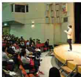
昨年度助成した 上映会・講演会

募集要項配布先 市民協働推進課、各行政センター、公民館 ※市ホームページから印刷できます 申込方法 必要書類(募集要項に記載)を、郵送または持参で市民協働推進課へ 申込期限 9月11日(金)必着 問合せ先 本市民協働推進課(☎22463)