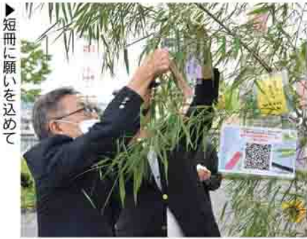
▶短冊に願いを込めて

7月5日、渋川駅前広場で行われた、渋川青年会議所主催による、「七夕事業」天まで届け「七夕の願い」のオープニングセレモニーに参加しました。 セレモニーでは、青年会議所の皆さんと一緒に、願い事を書いた短冊を竹の枝にくく