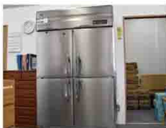
寄付された食品を保存する冷蔵庫

NPO法人いこいは、デイサービスいこの家を運営し、訪問介護、障害者支援サービスなどを行っています。5年ほど前からはフードバンクしぶかわを運営し、地域に貢献することを目的に活動しています。