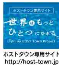
ホストタウン専用サイト http://host-town.jp

国歌の歌唱練習事業に指導者として参加できる 定員 3人(抽選) 参加料 無料 申込期限 8月31日(月) 申込み・問合せ先 電話で政策創造課へ その他 ホストタウン交流事業を活発にするため、講座の様子を動画として編集し、ホストタウン専用サイトに掲載する予定です