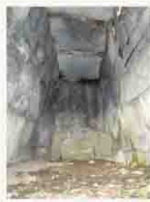
虚空蔵塚古墳の石室内部

今回紹介する虚空蔵塚古墳は、軽石層の上に造られた古墳です。場所は、市中心部から通称日陰道(ひかげみち)を北へしばらく進み、北西角に国土交通省事務所のある信号を左折して、伊香保温泉方面に少し向かった右側にあります。たどり着くと横穴式石室の入口部分がすぐ目に入ってきます。保存のためフェンス扉で閉じられていますが、中を十分覗けますので、石室の中の様子がよく分かります。石室が小さいことと、驚くほど見事な石材加工を施した石が使われていることが特徴です。この特徴は最後の段階である古墳終末期・7世紀後半に属することを示しています。しかも、これほど丁寧で、精巧に造られたものは、地域の最有力者に限られるものです。もう一つ、この古墳が教えてくれることとして、榛名山噴火から100年後には、地域の人々の努力により、ほぼ復興していたことが分かります。