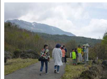
火山の山肌を散策

今回の学習を通じ、自然の力の大きさと、命のありがたみや力を合わせることの大切さを学べたのではないのでしょうか。