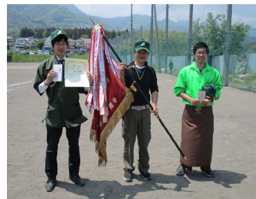
三度、優勝旗をその手に

5月7日（火）から17日（金）に渡り、「伊香保地区産業別野球大会」が開催されました。