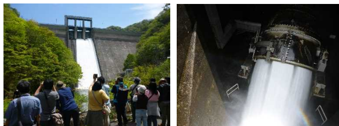
離れていても伝わる迫力 年に数度の一斉噴射