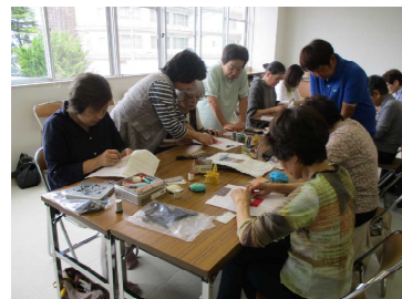
指先から集中して

当日は、講座を心待ちにしていた15名の受講者が集まり、思い思いのデザインの完成に向けて、雑談も交えながら和やかな雰囲気で作成を楽しみました。