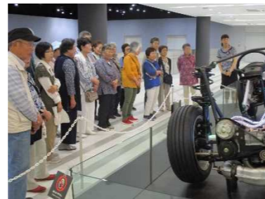
仕組みについても詳しく解説

スバル工場見学では、人と機械が一体となって、プレス、溶接、組立、検査と流れるように一台の車が作られる過程を見て、日本の高い技術力に感心していました。