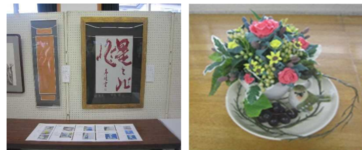
絵画や書、手芸などの工芸品を ぜひ、披露しませんか?