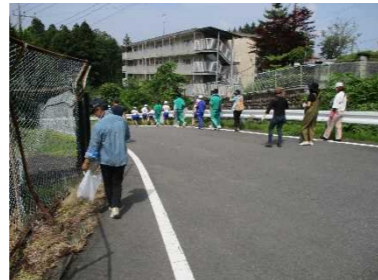
身も心も爽やかに

当日は天気不安定で、雨が心配されましたが、ゴミ拾いをしている間は、雨に降られず活動できました。