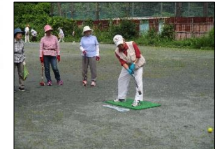
グラウンド・ゴルフ大会