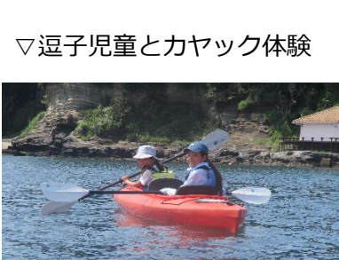
▽逗子児童とカヤック体験