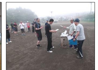
ソフトボール大会