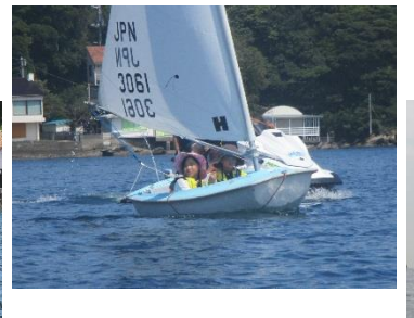
△帆に風受けデインギー体験