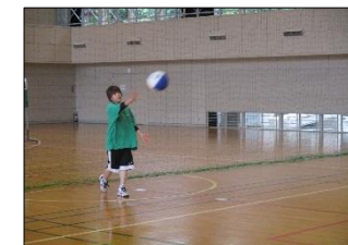
ソフトバレーボール大会