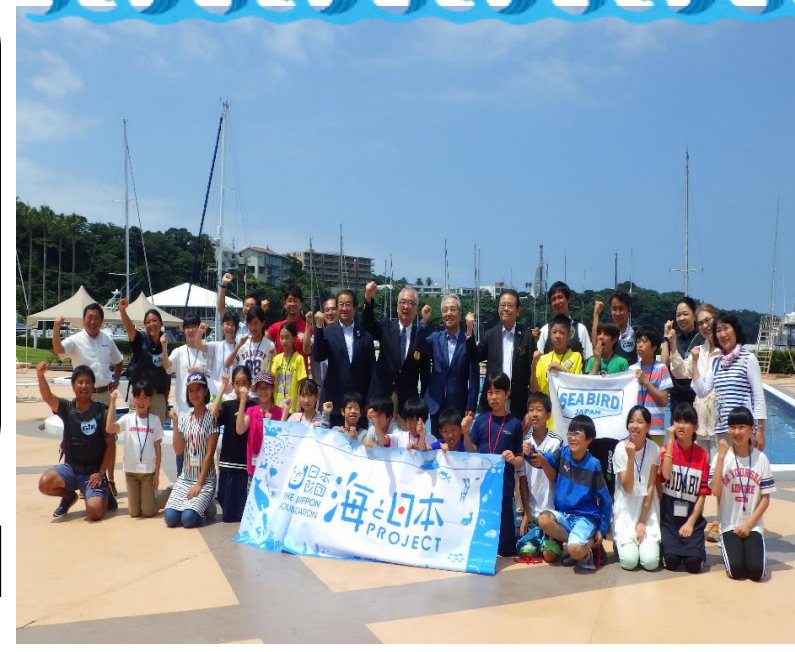
マリンアクティビティの前に逗子の子もたちと記念撮影

7月23日(火)～7月25日(木)の3日間、「逗子子ども交流教室」を実施しました。 本事業は、伊香保地区と逗子市の都市交流関係のシンボルです。39回と長い歴史を重ね、今年も伊香保小学校6年生児童11名が逗子市へ赴きました。 海水浴、干潟観察(生物観察)や、ヨット、カヤック、クルージングと海の楽しさに触れながら、逗子市児童と交流を深めました。 普段の生活ではつながることのなかった仲間や伊香保と違った文化や自然を学んだひと夏の機会は、子どもたちのこれからの人生にとっても貴重な経験となるのではないのでしょうか。