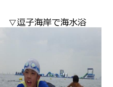
▽逗子海岸で海水浴