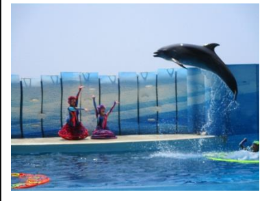
△水族館でのイルカショー