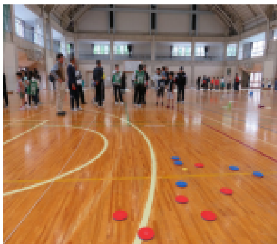
シャフルボード ディスク ← →