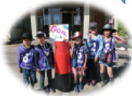
ゴール～みんなでポーズ～