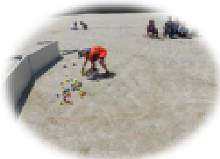
スタート前 ボール拾いゲーム

開催にあたっては、青少年育成推進員協議会の方に運営をサポートしていただいたほか、上ノ原病院、グローバルピッグファーム、群馬県県央第二水道事務所、上箱田自治会の方々に会場の借用等で大変お世話になりました。ご協力ありがとうございました。