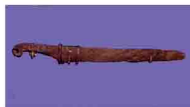
経塚古墳出土の蕨手刀

市内でも北橘地区の経塚古墳で、蕨手刀が出土しています。東北地方に出征した人がいたのかもしれませんが。