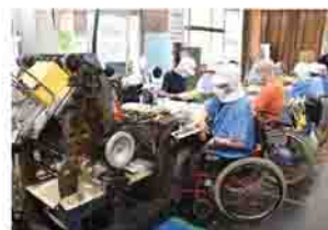
事業所ホテルの作業風景

渋川市内の福祉事業所(就労移行支援、就労継続支援A型・B型、生活介護、地域活動支援センター)による活動内容パネル展示