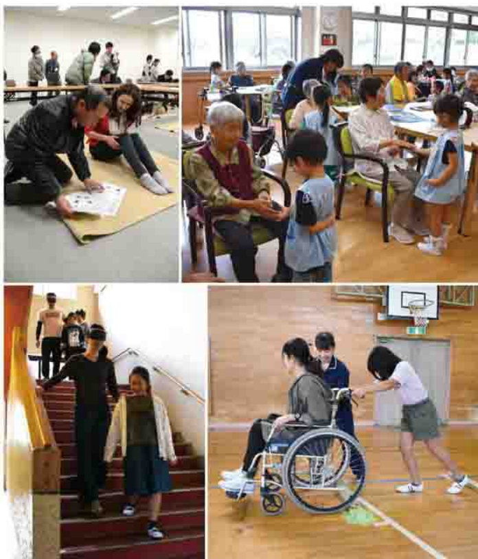
上段右：保育園児による高齢者施設の訪問 上段左：図絵でコミュニケーションを図る 災害時外国人支援講座