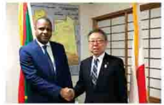
モーリタニア特命全権大使(左)

多文化共生の一環として、市がホストタウンとなっているモーリタニア・イスラム共和国について、モーリタ