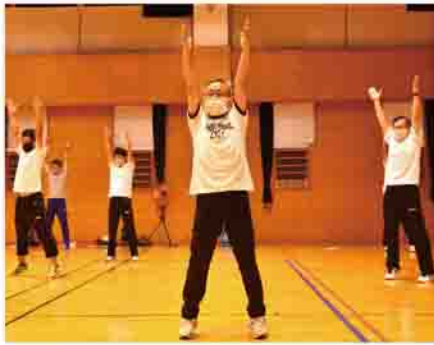
▶9月17日のラジオ体操講習会

♪新しい朝が来た希望の朝だ。喜びに胸を開け大空仰げ...♪ 『ラジオ体操第一!!』 日本人なら誰でも知っているラジオ体操。子どもの頃は夏休みに広場に集まって、真っ黒に日焼けした体で眠い目をこすりながら毎朝行いまし