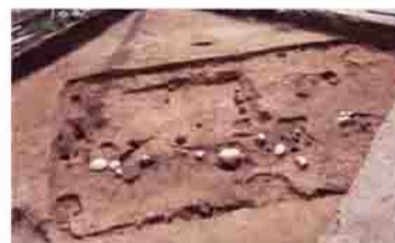
中筋遺跡で発見された鍛冶工房跡

日本の古代国家ができはじめる7世紀末には、中筋遺跡に鉄器作りの鍛冶工房が造られます。国の役所周辺にしかないような連房式と呼ばれる大きな鍛冶工房です。渋川で製鉄が始まるのはもう少し後なので、どこかで作った鉄素材を持ってきて、武器などの鉄器に加工したのでしょうか。それらは、上野国の役所に貢納され、蝦夷との戦いに使われたのかもしれませんが。