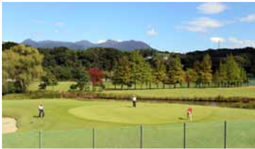
渋川市民ゴルフ場

答弁 食料や水などの備蓄品は、賞味期限切れ前に市内の防災訓練等において有効活用します。他の自治体への支援は、状況を確認し、要請に応じた物資提供を行います。