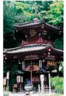
水沢寺六角二重塔

8日(火)午前9時〜午後5時 (土・日曜日を除く) 申込み問合せ先 電話か直接中央公民館(☎224321)へ