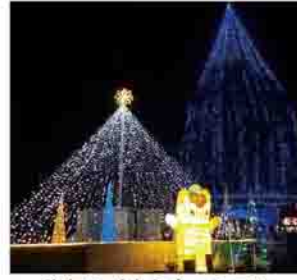
昨年のイルミネーション

渋川駅前広場および渋川駅前通りをメイン会場にして、「渋川まちなかイルミネーション」を開催します。色鮮やかに電飾された街路樹や噴水のモニュメント、市内高校生が作成したオブジェなど、約7万2千球のイルミネーションがまちなかの夜を彩ります。初日には、点灯式と市内高校生などのミニコンサートをを行います。 点灯期間 11月28日(土)～令和3年1月31日(日) 点灯時間 午後5時～10時