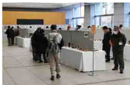
多くの作品が並ぶ近代こけしコンクール