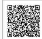
しぶかわ元気券の取扱店舗はこちら

使用期限を過ぎると、券は無効になります。券を持っている人は、早めに使用してください。詳しくは、 ■商工振興課(☎2596) へ。