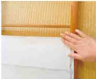
上手な障子の張り替え方を学びます