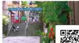
伊香保温泉 石段街の魅力