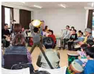
輪になって演奏を楽しむ ドラムサークルの活動

miru会は平成23年4月に設立され、渋川市をはじめ、榛東村・吉岡町の渋川広域圏で広く活動しています。主な活動内容として、子どもやその保護者向けに紙芝居や音楽会などのイベントを開催しています。