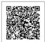
市ホームページはこちら

申込方法 申請書(商工振興課または市ホームページにあります)に必要事項を記入し、郵送、ファクスまたは直接商工振興課(〒377-8501・石原80・☎22132)へ提出してください 申込期限 令和3年1月29日(金) その他 登録手数料・換金手数料はかかりません