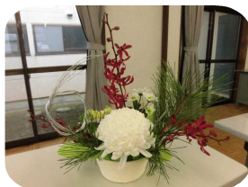
昨年度の作品です