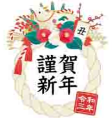
主な市内公共施設の年末年始業務日程