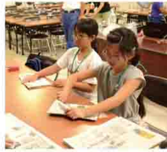
新聞紙で作る防災グッズ

定員 40人(先着順) 参加料 無料 持ち物 はさみ、のり、新聞紙(約1日分)、四角い2リットルペットボトル(2個)、10×15センチのLEDライト(持っている人のみ)