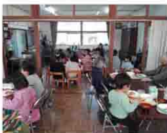
しんあい子ども食堂には地域のひとと子どもたちが集まります

世代を超えた地域の交流の場として、かつての信愛幼稚園園舎と園庭を活用し、令和元年から活動を始めました。「縁側」のように、誰でも立ち寄れる場でありたいと「えんがわカフェ」と名付けました。