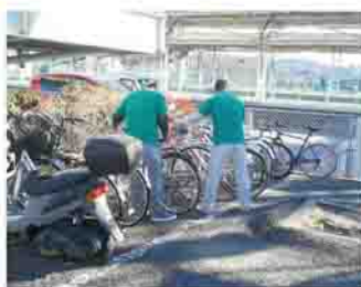
駅前の清掃、駐輪場の整理をする利用者たち

トポスはなみずきは、平成27年4月に渋川駅前商店街の中心に開設した、障害のある人の作業所で、まちづくりに協力しながら、就労継続支援B型事業所を開所しています。社会参加・地域との交流により、自立・一般就労への移行に向けた福祉サービスを行っています。