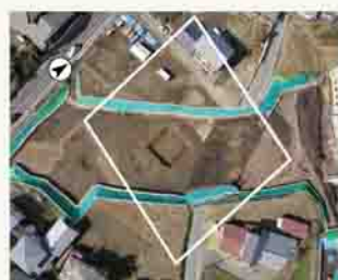
▲白線が囲い状遺構

ところが、発見された囲い状遺構は平行四辺形なのです。何故か？基本的な設計をもとに、東辺を固定したまま西辺を北に移動すると発見された平行四辺形の形になるのです。どうして整然とした長方形の外郭をわざわざ平行四辺形にしたのでしょうか。