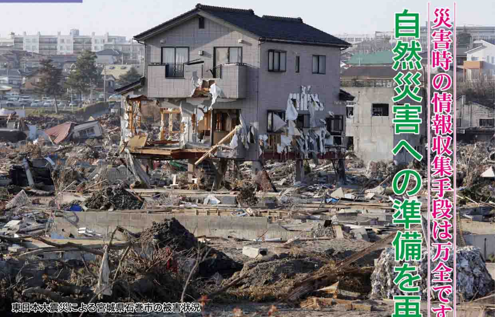
東日本大震災による宮城県石巻市の被害状況