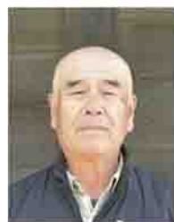
三原田獅子舞保存会 会長

中断していた獅子舞が昭和57年に復活するときに、踊り子として携わりました。平成11年に現事務局長を中心に再度復活したこの獅子舞には、地域の子どもたちも参加してくれます。今後も伝統文化として受け継がれていくことを願っています。