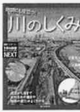
防災にも役立つ! 川のしくみ