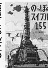
のっぽのスタイル155 こもり まこと