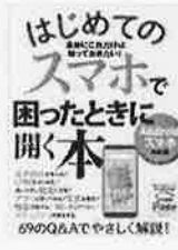
はじめてのスマホで 困ったときに開く本