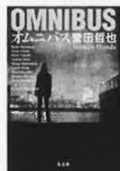
オムニバス 誉田 哲也