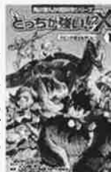
どっちが強い? X 1