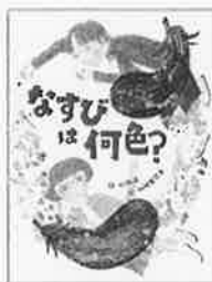
なすびは何色? 山本 泉