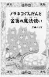
ノラネコぐんだんと 金色の魔法使い