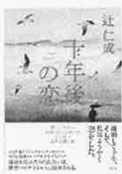
十年後の恋 辻 仁成