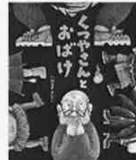
くつやさんとおぼけ いわさき さとこ