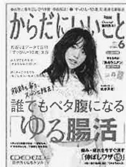
からだにいいこと