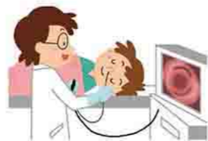
(別表4) 胃内視鏡検査指定医療機関

検査期間 6月1日(火)～12月25日(土) 受診場所 指定医療機関(別表4のとおり) ※検査方法は、経鼻または経口の選択ができます 期間・対象・定員など 別表3のとおり 申込方法 電話または直接市保健センターへ 申込期間 4月5日(月)～30日(金) 注意事項 ▷今年度この検査を受診した人は、来年度の市の胃内視鏡検査・胃部X線検査(バリウム)は受診できません ▷同一年度内に、胃内視鏡検査と胃部X線検査の両方は受診できませんので、注意してください ▷新型コロナウイルス感染症の流行状況によっては検査の実施体制が変更となる可能性があります 問合せ先 ■市保健センター(☎1321)