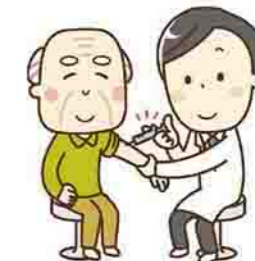
(別表1) 令和3年度高齢者肺炎球菌ワクチン定期予防接種対象者

【定期接種の対象以外の方の接種】 対象 接種当日75歳以上の人で、今年度定期接種の対象でない人(以前の接種で市の定期接種助成を利用している場合は、対象になりません) 助成額 2,000円 接種方法 事前に市保健センターで予診票の交付を受けてから、保険証、予診票を持参して、実施医療機関で接種してください 注意事項 前回の接種から5年以上の間隔を置かないと、再接種のときに激しい副反応が現れることがあります。過去の接種歴を必ず確認してください 問合せ先 ■市保健センター(☎1321)