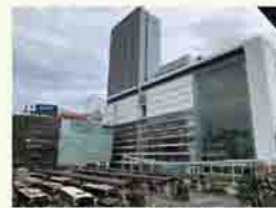
昨年開業したJR横浜タワー

横浜は、おしゃれで坂の多いまちの印象が強いと思いますが、私が住んでいた瀬谷区は、土地も平坦で落ち着いた雰囲気です。大和市や町田市に隣接する緑の多い住宅街で、横浜市中心部や都心部のベッドタウンとして発展しました。鉄道で都心へ乗り換えなしで行けて、来年度は2つめの路線が開通します。公共交通機関が整備されて生活しやすいのが横浜の良いところです。思い出の場所は、横浜駅前です。百貨店も多くて何でも揃い、子どもの頃から何かあれば出掛けていました。