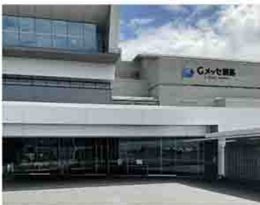
接種会場のGメッセ群馬

※8月10日時点で、県央ワクチン接種センターでは17歳以下の人は接種できません 予約方法 「ぐんまワクチン接種LINE予約システム」で予約