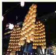
竿燈まつりは8月開催

渋川には、夫が家業を継ぐので引越してきました。秋田市は海、渋川は山という違いはありますが、雰囲気似ていてすぐに馴染めました。息子を散歩させていると、挨拶してくれる人がたくさんいて、渋川は人が温かいと思います。