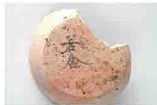
八木原沖田遺跡出土の墨書土器

渋川市内でも多くの墨書・刻書土器が見つかっています。八木原沖田遺跡では「若舎」と書かれた墨書土器があり、王宮に仕えた「舎人」という役職と関係がありそうです。右原久保貝道北遺跡では、「上毛」と刻まれた刻書土器の壺が発見されました。上野の中核的な氏族である「上毛野氏」の一族が住んでいたのかも知れません。