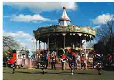
▲昨年コンテストの最優秀賞

応募期限 11月30日(火) 表彰 ▼最優秀賞(賞状・副賞3万円) 〓1点 ▼優秀賞(賞状・副賞1万円) 〓3点 ▼佳作(賞状・副賞5千円) 〓10点