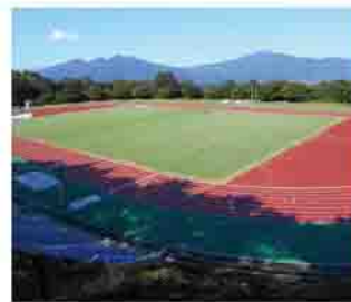
▲市総合公園陸上競技場

申込方法 市ホームページから申込書をダウンロードし、郵送〒377-8550 1・石原80)または直接申し込んでください 申込み・問合せ先 ▽市民会館 政策創造課(☎22)23(96) ▽市総合公園陸上競技場 都市政策課(☎22)2073)