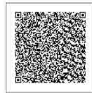
▲市まちづくり財団ホームページはこちら

著作権・肖像権を侵害しないもの 応募方法 応募用紙(市まちづくり財団ホームページまたは市民会館にあります)に必要事項を記入し、作品の裏面に貼り付けて、持参または郵送で市まちづくり財団〒377-0008 渋川(上郷2795)へ