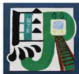
作品名：駅 種別：絵文字 サイズ：縦20cm×横22cm