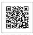
▲こちらからアクセスできます

市が災害時に開設する避難所の位置や混み具合を、スマートフォンやパソコンなどでリアルタイムに確認できます。混雑状況が随時確認できることで、コロナ禍での3密回避や分散避難にもつながります。混雑状況は「空いています」「やや混雑」「混雑」「満」の4段階で表示されます。左記2次元コードから確認してください。