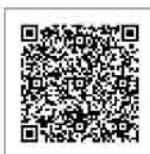
▲市ホームページはこちら