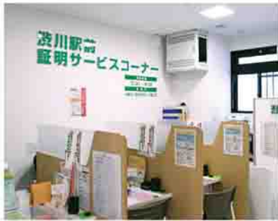
▲渋川駅前証明サービスコーナー