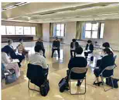
協議体の活動風景