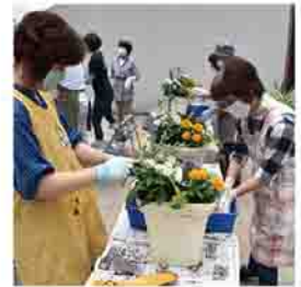
▲昨年行われた体験教室の様子