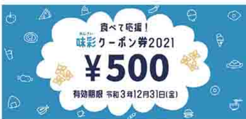
青色の券の使用期限は12月31日(金)まで