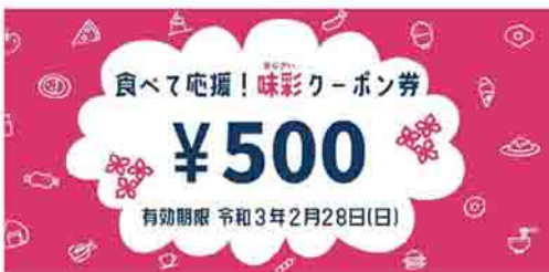
ピンクの券の使用期限は10月31日(日)まで