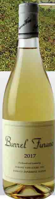
Barrel 2017 2017 2017

富良野市は、北海道のほぼ中心に位置しています。東方の十勝岳連邦、西方の芦別岳、南方の東京大学北海道演習林に囲まれ、面積の約7割が山林です。南北に空知川が流れ、昼夜の寒暖差は格別な甘みの果物と野菜を生み出します。ふらのメロン、ふらのチーズ、ふらのワインを代表に農産物と特産品の種類が豊富です。夏はラベンダー、冬はスキーと年間を通して観光客が訪れます。