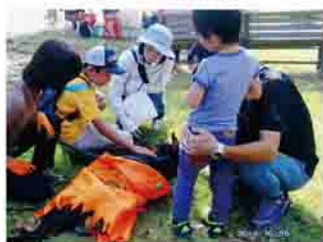
命の大切さを知るふれあいイベントの様子

活動を始めて4年目の団体で、会員21人により、主に保護された犬猫の新しい飼い主様との橋渡しを行っています。