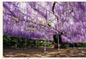
あしかがフラワーパークの藤

小さい頃に、実家の近くにあしかがフラワーパークの前身である早川農園があって、大藤を見に行ったことを覚えています。市街中心部の織姫神社や足利学校も友達と行った思い出の場所です。織姫神社は紅葉が美しく、足利学校へはよく図書館に通いました。家族と一緒に見た足利花火大会も思い出深いです。