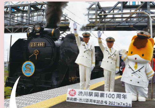
新前橋～渋川百周年記念号の出発式