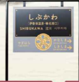
SLが停車する駅では、SLをイメージしたこの駅名標のデザインに統一されています。