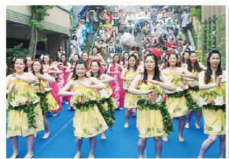
伊香保ワイアンフェスティバル