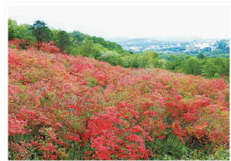
長峰公園のツツジ