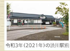
令和3年(2021年)の渋川駅前