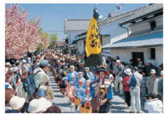
白井宿八重ざくら祭り