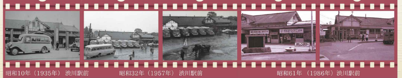
昭和10年(1935年) 渋川駅前