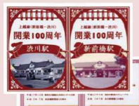
記念台紙・来駅記念券