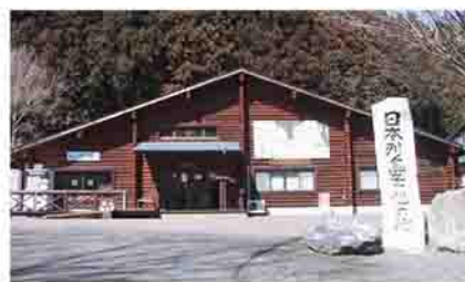
▲体験型宿泊施設蓬山ログビレッジに設置された「日本列島中心の地」の礎

(※)北海道の最北端(稚内市・弁天島)と九州の最南端(佐多町・大輪島)からそれぞれ同じ距離となる太平洋側と日本海側の海岸線上の2点を結んだ線の間中点