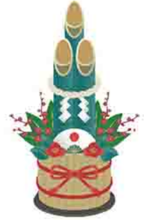
主な市内公共施設の年末年始業務日程

※各施設とも、新型コロナウイルスの感染状況により営業時間が変更または休止になる場合があります