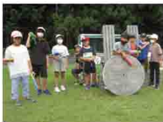
日曜冒険遊び場教室

いつでもどこでも、誰もが楽しんでスポーツができるよう、約20年前から活動を始め、平成25年にNPOになりました。遊びの要素の強い子ども向けの教室や中高年の健康づくり教室を実施している一方、ローラー・アイススケート養成教室からは、アスリートを輩出しています。複数種目を扱い、利用者は4歳から86歳までと、スポーツの楽しさを広める活動を幅広く行っています。