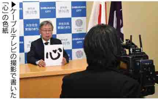
▶ケーブルテレビの撮影で書いた「心」の色紙

毎年年末に、ジェイコムというケーブルテレビの取材で、新年の抱負を色紙に書いてほしいと依頼されます。昨年は、「コロナを克服したい」「貧困や差別を克服し共生