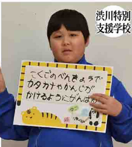
渋川特別 支援学校