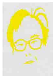
作品名：シールアート・顔 種別：平面構成 サイズ：42.5cm×30.3cm