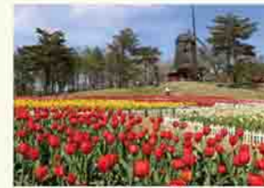
春から晩秋まで楽しめるフォリストパーク・軽米

里帰りした時は、「雪谷川ダムフォリストパーク・軽米」へ行きます。15万本のチューリップと風車の景色はとても美しく、いろいろ楽しめる自然森林公園で、皆さんにおすすめる場所です。