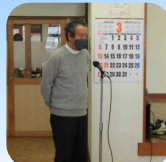
針塚会長のごあいさつ