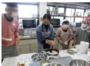
先生の説明と実演

「桜もちを作りたいわ。」というみなさんのお声から「魅惑のお菓子づくり講座」を続けることにしました。2月は「ガトーショコラ」でしたが、今回は、和のスイーツ「桜もち」です。桜の葉の香りが漂ってきました。この後、ベーグルづくりの講座を行う予定です。お菓子づくりに興味のある方、ぜひご参加ください。(3月22日実施)