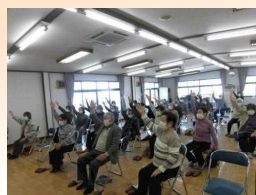
行幸田・中村のみなさん