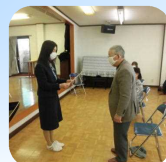
代表の方に皆勤賞をお渡ししました