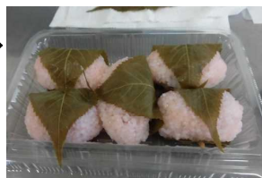
桜餅の出来上がり！

6月に「ベーグル」づくりの講座を行う予定です。興味のある方の参加をお待ちしています。