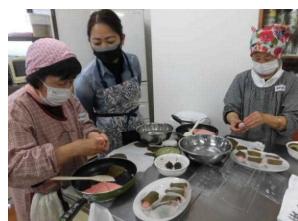
いよいよ自分が作ります