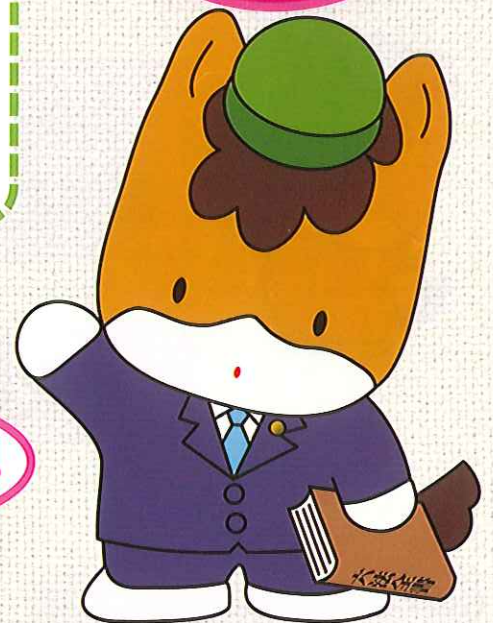
群馬県のマスコット 「くんまちゃん」