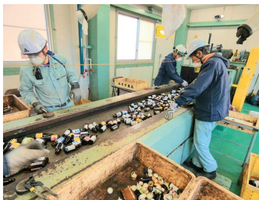
清掃センターでの手作業による分別作業

建設交通部長 瑕疵担保責任について、資材納入業者に請求できるのか確認をさせていただきます。