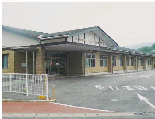
休診している国保あかぎ診療所

スポーツ健康部長 幅広い視点で検討していただく外部委員会で協議を進めています。現時点では、今後の方向性が示されていないことから、診療所を継続するための医師確保は行っておりません。