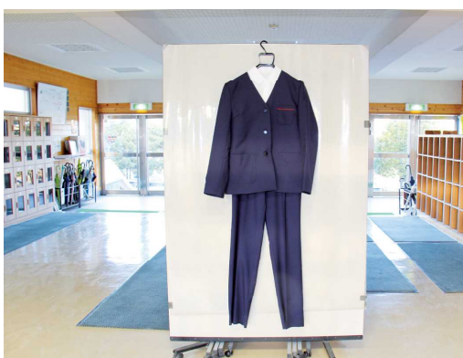
自由選択制となる中学校の制服

教育長 教職員の配置や特別の教育課程を編成するための研究等多くの課題があるため、現時点で検討を進めるのは難しいと考えます。ただ、令和の日本型学校教育の基本理念に通じるところもあり、その理念を生かしてよりよい教育環境・内容の充実を図ります。