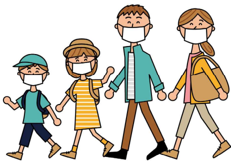
マイクロツーリズム

産業観光部長 旅行者のニーズが感染症対策等に変化しています。誰もが安心して訪れ、長期滞在できる観光地となるよう支援します。