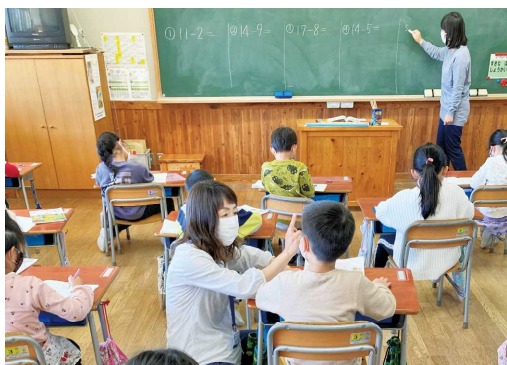
スタディアシスタント事業の様子 (市内小学校低学年教室で)

スポーツ健康部長 子宮頸がんワクチンについては国の方針に基づき積極的勧奨を再開できるよう準備します。同時に接種機会を逃した方への対応も検討していきます。带状疱疹ワクチンの公費助成については引き続き研究していきます。