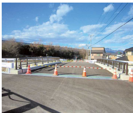
芝附橋周辺道路に歩道の設置を

総務部長 農地の上に建物があることを確認したので、遡及し宅地とし適正な課税を行いました。家は調査を行い課税対象であれば適正に課税したいと考えています。