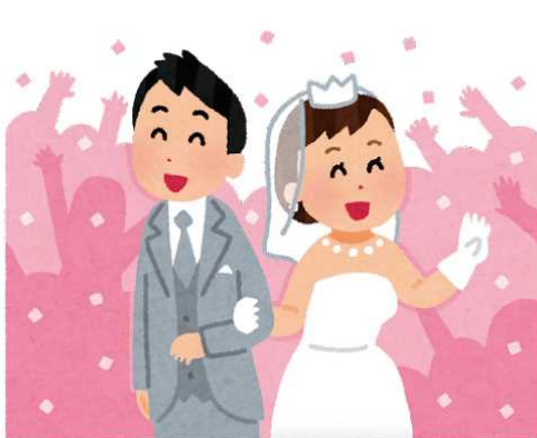
市民のしあわせが第一

総合政策部長 今年度開始したばかりの制度でありますので、ご利用いただいた方々の実態等を確認し、この制度利用により、多くの人々に渋川市に住み続けていただくよう、検証してまいります。