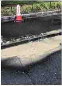
道路上の漏水は すぐに連絡を