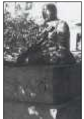
巡拝塔 (八崎 北町)