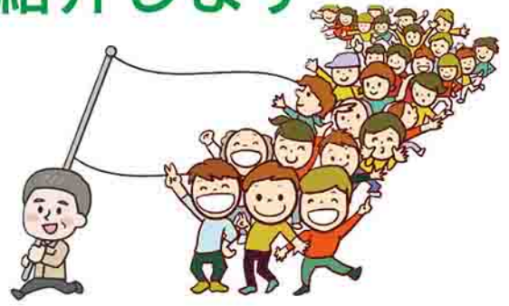
令和4年度自治会長一覧(○印は各地区の連合会長)