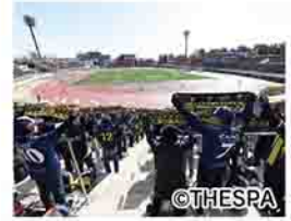
正田醤油スタジアム群馬

「ザスパの恩返しプロジェクト」の一環として、ザスパクサツ群馬のホーム戦(対町田ゼルビア)に、市民の皆さんを無料招待します。