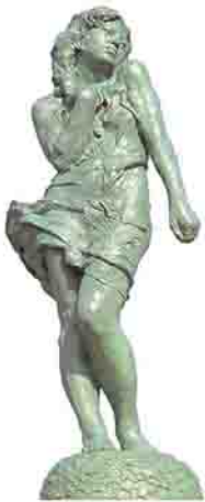
《麗陽》 桑原巨守作 1982年