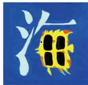
作品名：海 種別：絵文字 サイズ：縦19.5cm×横19.8cm