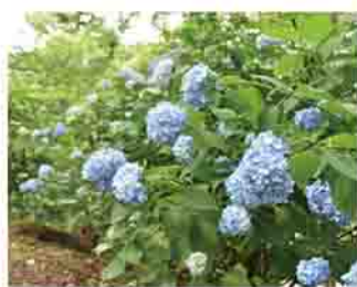
あじさい公園のアジサイ

●アジサイの見頃 ▷6月中旬～7月下旬:国道17号中村地区(中村) ▷6月下旬～7月上旬:小野池あじさい公園(渋川2979)、真光寺(渋川748) ▷6月下旬～7月中旬:渋川スカイランドパーク(金井2843-3)、市総合公園(渋川4272)