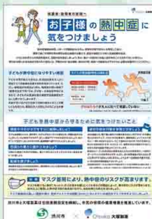
▲熱中症対策の啓発チラシを作成

今後は、7月に開催する市民環境大学で、気候変動対策に関連した熱中症対策セミナーの実施を予定しています。また、糖尿病対策や睡眠改善のセミナーも開催し、さまざまな側面から健康管理に貢献したいと考えています。