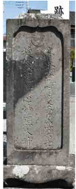
高橋蘭齋の墓 (市指定史跡)

〈本庁舎会場〉 とき 6月9日(木)～16日(木) 午前8時30分～午後5時15分(市役所閉庁日は除く) ※9日は午後0時30分から ところ 1階市民ホール 〈第二庁舎会場〉 とき 6月20日(月)～24日(金)