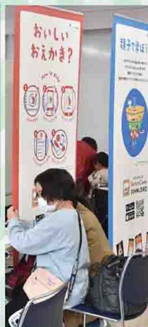
しづかわ市民まなびの日に出展