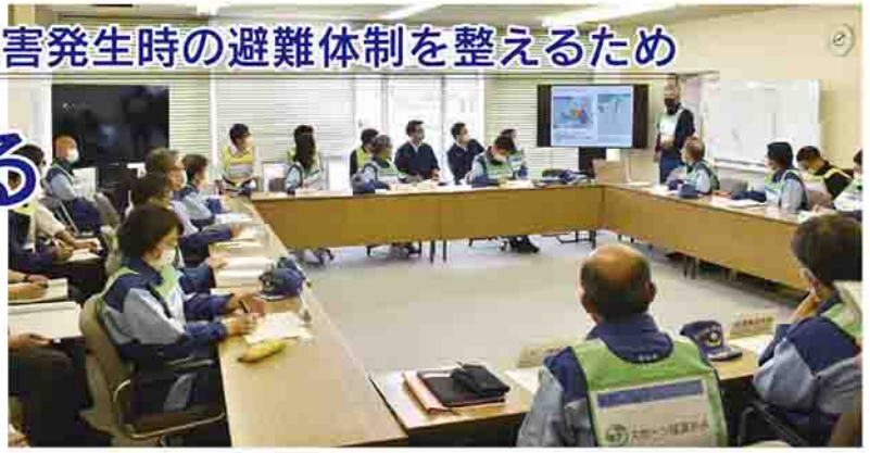
災害対策本部図上訓練(5月20日)

国は、避難に対する基本姿勢として『住民は自らの命は自らが守る』意識を持ち、自らの判断で避難行動をとり、「行政はそれを全力で支援する」という住民主体の、より防災意識の高い社会の構築へとかじを切りました。