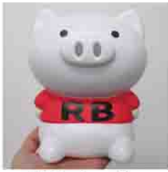
体操ブービー (曲が流れます)